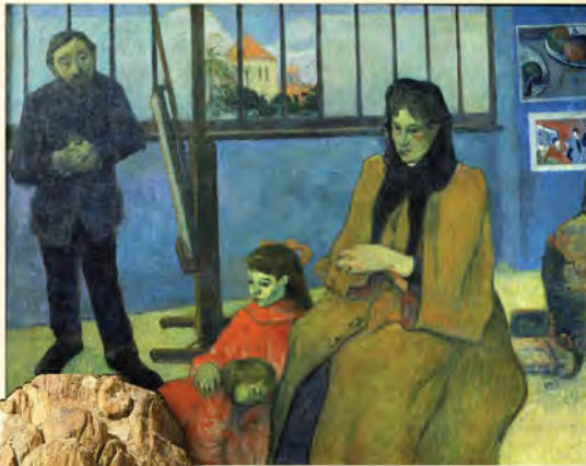
Family Schuffenecker, Gauguin. Reliquary Bust of Charlemagne, 1349, Cathedral Treasury, Aachen.

This rich art image database, available exclusively on WilsonWeb, now offers more than 155,000 works from an impressive roster of distinguished international museum sources.