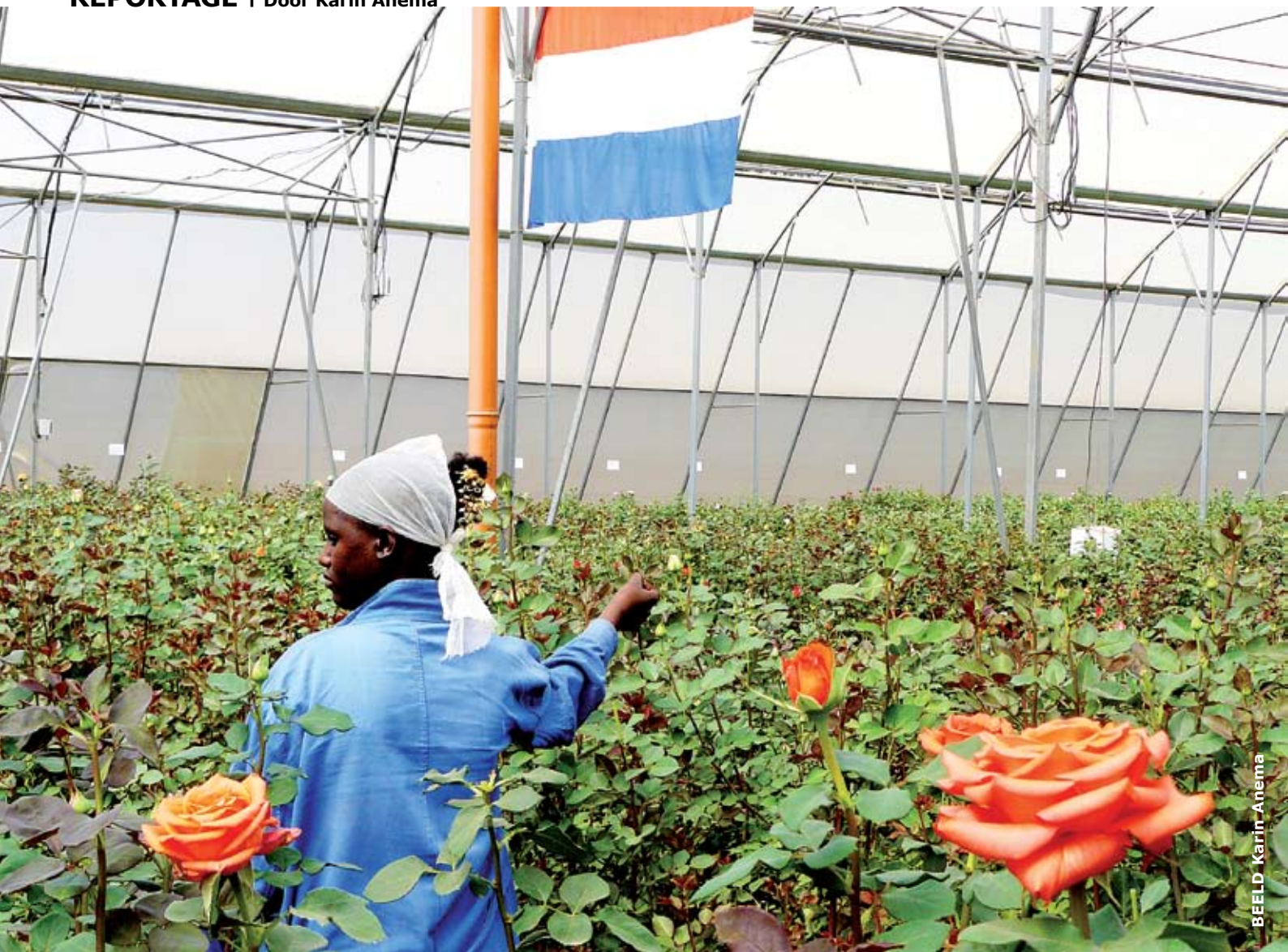
BEELD: Karin Anema