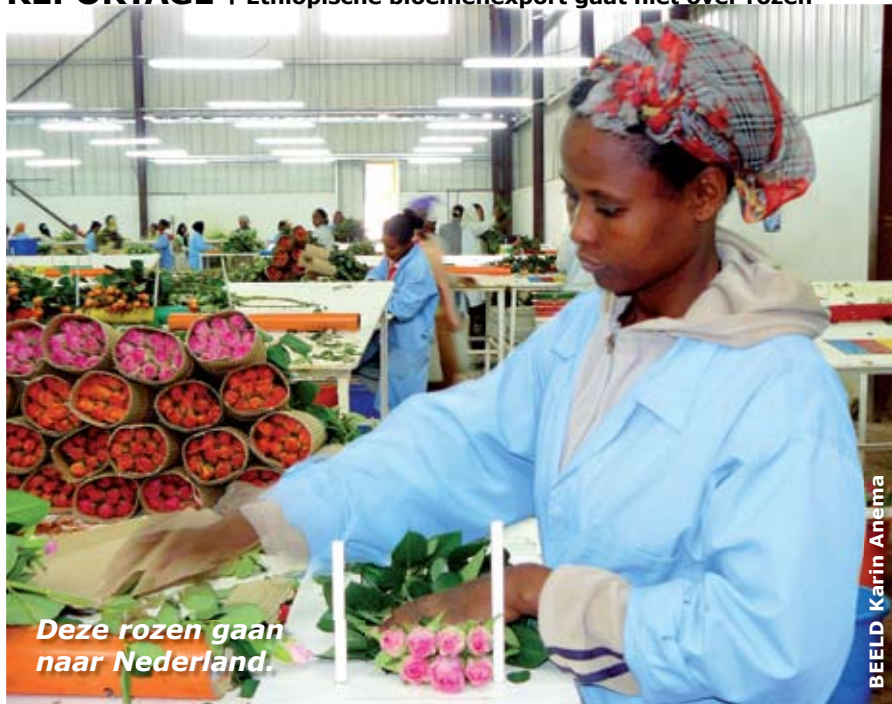
Deze rozen gaan naar Nederland.