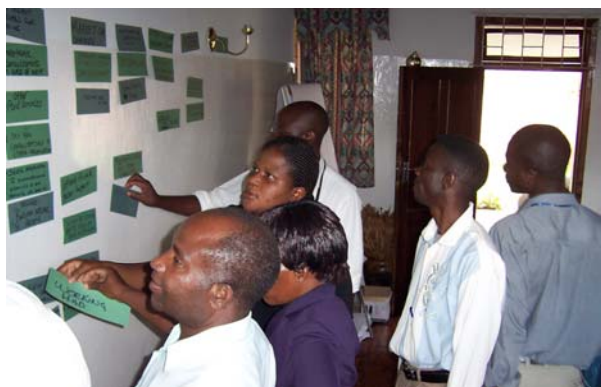
Socios de un proyecto en una sesión de torbellino de ideas sobre sustentabilidad financiera durante un encuentro de Grupos Beneficiarios en Zambia.

Para poder comprender realmente el valor agregado de M&E, es preciso ante todo comprender que este sistema es parte de un proceso mayor dentro del IICD, a saber, los programas nacionales de esta institución. Un programa nacional se sustenta en un enfoque sistemático, holístico, que consiste en Talleres de “Mesas Redondas”, en el desarrollo de capacidades, el Intercambio de conocimientos, el trabajo en red y el