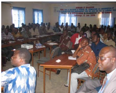
Seminario de concientización acerca del potencial de la TIC en la educación en la ciudad de Tenkodogo (region centro-este de Burkina Faso).

El impacto en las organizaciones o en el sector en su conjunto es medido por medio de indicadores tales como el mejoramiento en los materiales de enseñanza aprendizaje y en las técnicas de aprendizaje, en el acceso a la infraestructura y a la conectividad en las escuelas y en el desarrollo profesional de los docentes. Durante el transcurso del proyecto, el impacto en el sector declinó ligeramente y mostró una tendencia a rezagarse respecto de otros indicadores de impacto. Las posibles causas de esto fueron analizadas durante el encuentro del grupo focal. Algunos participantes explicaron que los maestros no tienen suficientes incentivos para participar en las actividades de capacitación en sus escuelas secundarias, debido a que pueden ganar más dinero si invierten ese mismo tiempo para enseñar en escuelas secundarias privadas.