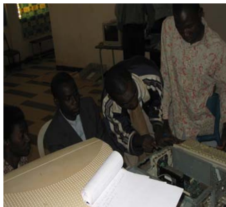
Docentes realizando ejercicios prácticos durante el curso de capacitación para el mantenimiento de computadoras.

Uno de los desafíos más importantes es incrementar la participación de las mujeres en las actividades del proyecto. El proyecto está considerando la creación de una reserva de docentes mujeres para que desarrollen el 'programa de género' y una capacitación que apunte específicamente a las mujeres. Por ejemplo, en algunas áreas geográficas (como por ejemplo Pô), se identificaron las docentes mujeres que aún no habían participado en el proyecto, para que reciban capacitación y para que participen en las actividades del mismo.