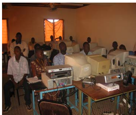
Grupo de docentes en una capacitación sobre multimedia.