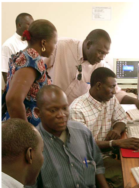
Capacitación de maestros de TICE

Los socios también alentarán las acciones de gobierno tendientes a terminar de formular una política TIC para la Educación y presionarán para lograr la inclusión oficial de las TIC en los programas de estudio. El jefe del proyecto TICE-Burkina se ha convertido en una persona de consulta para el ministro de la educación secundaria y ha ofrecido asistencia para formular recomendaciones para la política en 2007. Esto conducirá probablemente a establecer lazos más estrechos entre el proyecto y la política del ministerio de manera tal que se puedan obtener además otros resultados indirectos.